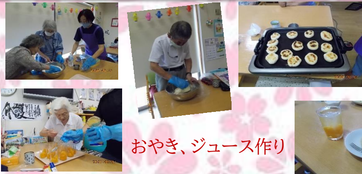
おやき、ジュース作り